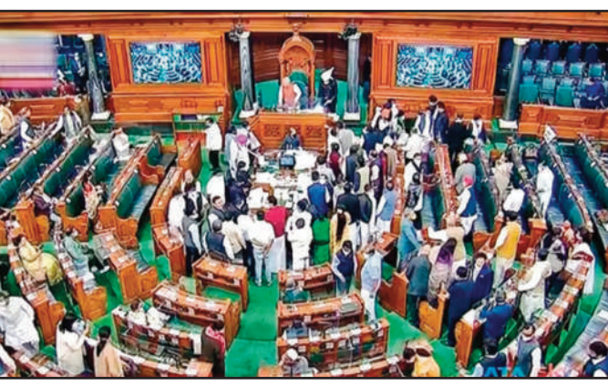
ਜੇਕਰ ਲੋਕ ਸਭਾ ਦੇ ਅੰਕੜਿਆਂ 'ਤੇ ਨਜ਼ਰ ਮਾਰੀਏ ਤਾਂ ਵਿਰੋਧੀ ਧਿਰ ਨੂੰ ਇਕ ਵਾਰ ਫਿਰ ਹਾਰ ਦਾ ਮੂੰਹ ਦੇਖਣਾ ਪਵੇਗਾ, ਕਿਉਂਕਿ ਲੋਕ ਸਭਾ 'ਚ ਐਨਡੀਏ ਮਜ਼ਬੂਤ ਸਥਿਤੀ 'ਚ ਹੈ। ਲੋਕ ਸਭਾ ਵਿੱਚ ਭਾਜਪਾ ਦੇ ਇਕੱਲੇ 301 ਸੰਸਦ ਮੈਂਬਰ

ਨਵੀਂ ਦਿੱਲੀ (ਬਿਊਰੋ) — ਮਨੀਪੁਰ ਮੁੱਦੇ 'ਤੇ ਸੰਸਦ ਦੇ ਦੋਵਾਂ ਸਦਨਾਂ 'ਚ ਹੰਗਾਮਾ ਹੋਇਆ। ਇਸ ਮੁੱਦੇ 'ਤੇ ਵਿਰੋਧੀ ਧਿਰ ਕੇਂਦਰ ਸਰਕਾਰ ਵਿਰੁੱਧ ਬੇਭਰੋਸਗੀ ਮਤਾ ਲਿਆ ਦਿੱਤਾ ਹੈ। ਕਾਂਗਰਸ ਦੇ ਸੰਸਦ ਮੈਂਬਰ ਗੌਰਵ ਗੋਗੋਈ ਨੇ ਲੋਕ ਸਭਾ ਵਿੱਚ ਕੇਂਦਰ ਸਰਕਾਰ ਖਿਲਾਫ਼ ਬੇਭਰੋਸਗੀ ਮਤੇ ਦਾ ਨੋਟਿਸ ਦਿੱਤਾ ਹੈ। ਇਸ 'ਤੇ ਸਰਕਾਰ ਦਾ ਬਿਆਨ ਵੀ ਸਾਹਮਣੇ ਆਇਆ ਹੈ। ਸੰਸਦੀ ਕਾਰਜ ਮੰਤਰੀ ਪ੍ਰਹਿਲਾਦ ਜੋਸ਼ੀ ਨੇ ਵਿਰੋਧੀ ਧਿਰ 'ਤੇ ਹਮਲਾ ਬੋਲਿਆ ਹੈ। ਪ੍ਰਹਿਲਾਦ ਜੋਸ਼ੀ ਨੇ ਕਿਹਾ ਕਿ ਲੋਕਾਂ ਨੂੰ ਪੀਐਮ ਮੋਦੀ ਅਤੇ ਭਾਜਪਾ ਵਿੱਚ ਵਿਸ਼ਵਾਸ ਹੈ। ਉਨ੍ਹਾਂ (ਵਿਰੋਧੀ) ਨੇ ਪਿਛਲੇ ਕਾਰਜਕਾਲ ਵਿੱਚ ਵੀ ਬੇਭਰੋਸਗੀ ਮਤਾ ਲਿਆਂਦਾ ਸੀ। ਕੇਂਦਰੀ ਮੰਤਰੀ ਨੇ ਕਿਹਾ ਕਿ ਇਸ ਦੇਸ਼ ਦੀ ਜਨਤਾ ਨੇ ਉਨ੍ਹਾਂ (ਵਿਰੋਧੀ ਧਿਰ) ਨੂੰ ਸਬਕ ਸਿਖਾ ਦਿੱਤਾ ਹੈ।