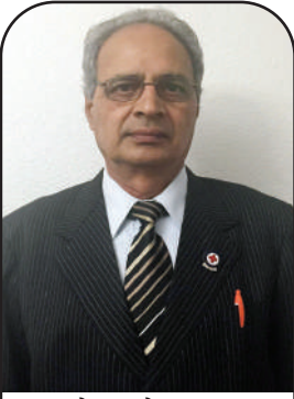
ਪ੍ਰੋ: ਐਚ. ਐਲ. ਕਪੂਰ

ਲਈ ਬੜੀ ਹਮਦਰਦੀ ਤੇ ਪਿਆਰ ਦਾ ਇਜ਼ਹਾਰ ਕੀਤਾ। ਰਾਜੇ ਦੇ ਦਰਬਾਰੀ ਜਦੋਂ ਉਨ੍ਹਾਂ ਚੋਰਾਂ ਨੂੰ ਵਿਦਾਈ ਦੇਣ ਗਏ ਤਾਂ ਜੈਦੇਵ ਪ੍ਰਤੀ ਉਨ੍ਹਾਂ ਦੇ ਇਤਨੇ ਪਿਆਰ ਤੇ ਸੇਵਾ ਪ੍ਰਤੀ ਗੱਲ ਪੁੱਛੀ ਤਾਂ ਡਾਕੂਆਂ ਨੇ ਬੁਠੀ ਕਹਾਣੀ ਬਣਾ ਕੇ ਸੁਣਾਈ।