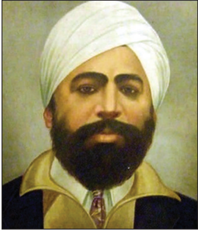
ਮਹਾਨ ਸ਼ਹੀਦ ਸ. ਉਧਮ ਸਿੰਘ ਦੇ ਸ਼ਹੀਦੀ ਦਿਵਸ 'ਤੇ ਅਦਾਰਾ 'ਦੇਸ਼-ਦੁਆਬਾ' ਵੱਲੋਂ ਕੋਟਿ-ਕੋਟਿ ਪ੍ਰਣਾਮ। 31 ਜੁਲਾਈ, 2022 ਲਈ ਸ਼ਹੀਦ ਉਧਮ ਸਿੰਘ ਦੇ ਸ਼ਹੀਦੀ ਦਿਵਸ ਨੂੰ ਸਮਰਪਿਤ ਵਿਸ਼ੇਸ਼ ਲੇਖ ਅੰਦਰ ਦੇਖੋ।

ਮੁੱਖ ਸੰਪਾਦਕ : ਪ੍ਰੋਮ ਕੁਮਾਰ ਚੰਬਰ ਸੰਪਰਕ : 916-947-8920 ਫੈਕਸ : 916-238-1393 E-mail : deshdoaba@yahoo.com ਸੰਪਾਦਕ : ਤਰਸੇਮ ਜਲੰਧਰੀ / ਵਿਵੇਕ ਭਾਟੀਆ